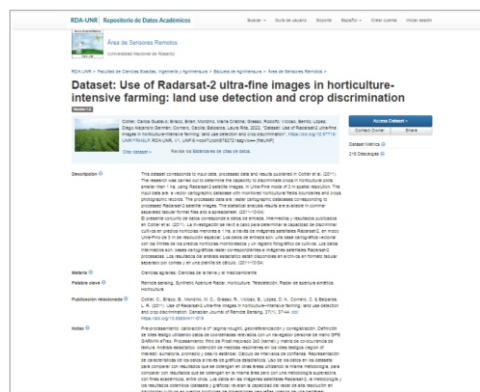
Ejemplo de dataset curado y publicado en RDA-UNR DOI: https://doi.org/10.57715/UNR/YRH5LP